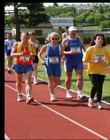
Épreuve de marche aux inter-clubs