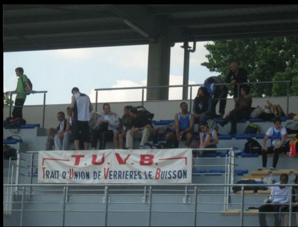
Le stand TUVB au inter-club de Longjumeau