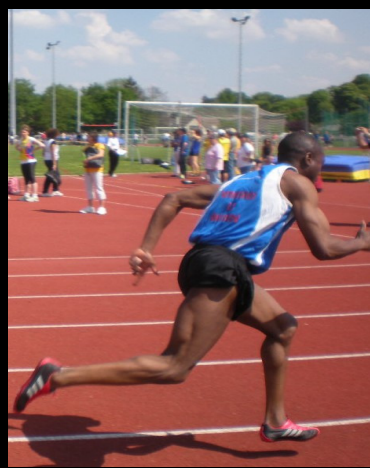
Départ du 100m aux inter-clubs